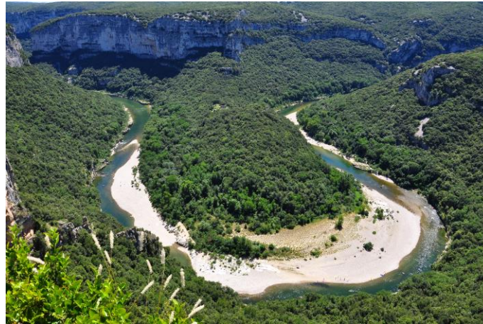
Schlögener Schlinge (OÖ)